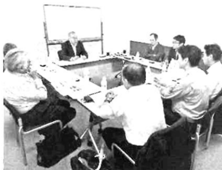
南富士によるアジア進出企業に対するコンサルティング

アジアで人材育成を手掛ける南富士(三島市)は、中小企業のアジア進出支援を全国規模に広げる。首都圏や近畿圏を含む全国の地方銀行15行と提携し、地銀顧客の海外展開における人材や経営問題を個別対応する。同社の人材育成事業で培ったアジアでのネットワークを活用するとともに、人材紹介事業の拡大にもつなげていく考えだ。